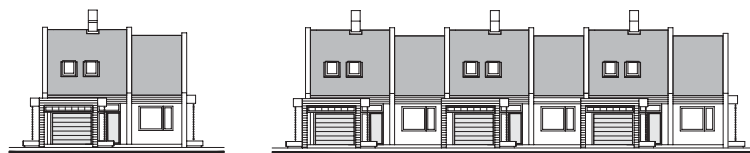
APLIKÁCIA PROJEKTU DO RADOVEJ ZÁSTAVBY