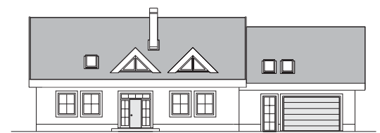
bočný pohľad s alternatívne riešeným podkroviem v zadnej časti